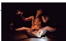
En el marco del Congreso Internacional Artes en Cruce (CIAC) .