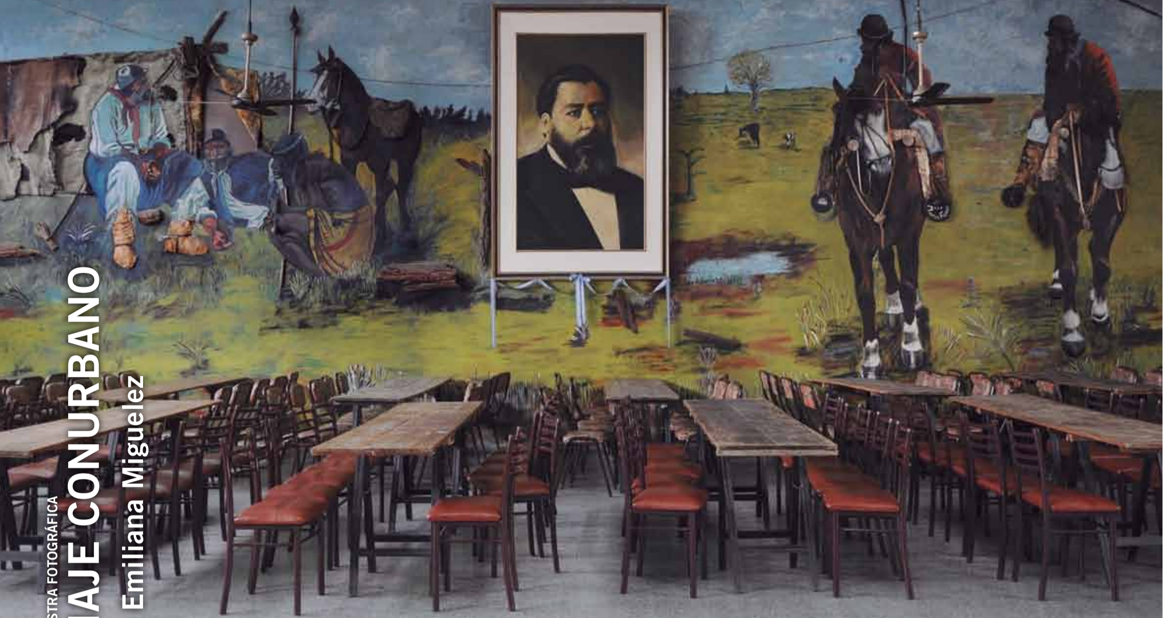
Fotografía, Salón de baile, retrato de José Hernández, autor del Martín Fierro , 2009 Fotografía La conquista de la serie Viaje Conurbano , 2008