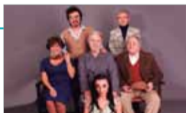
Dedicado a la memoria de Walter Santa Ana