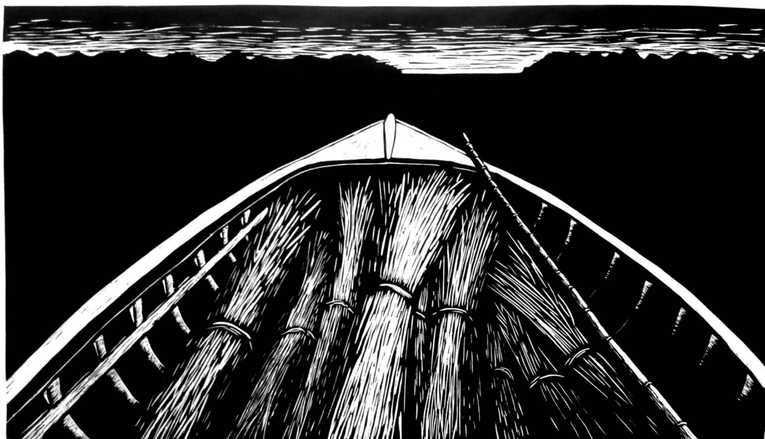
Fin de jornada. Xilografía. | El hombre y el junco. Xilografía.